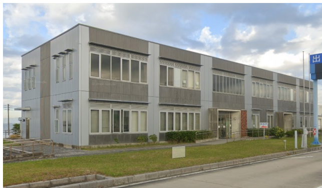
[りんくう本線料金所] 愛知県常滑市りんくう町2丁目14-2