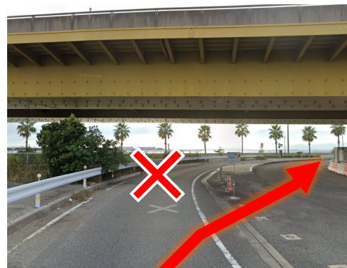
地図④ 高架下で右側に入る